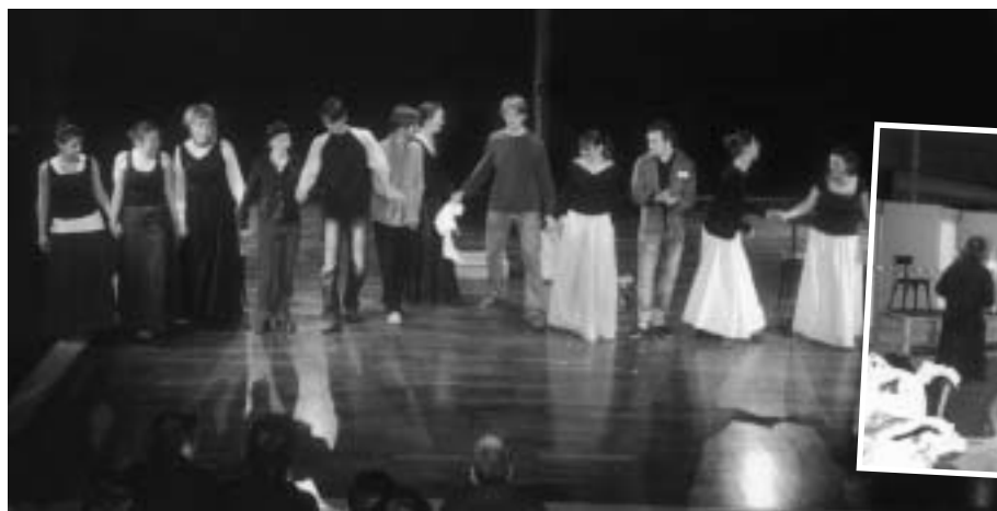
Les ateliers de création du Service universités culture.