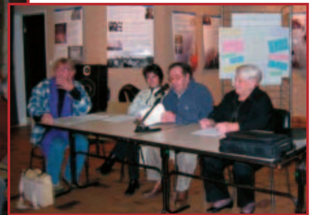
Une assistance nombreuse et intéressée lors d'un débat organisé à Vic-le-Comte autour de l'exposition du centenaire de la Loi de 1905.

"Tant que quelque part dans le monde des êtres humains verront leur vie inféodée à une religion d'État, tant que certains seront privés de libertés et que d'autres seront en danger à cause de leurs convictions, le combat laïc sera d'actualité."