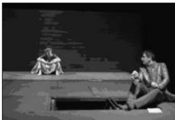
"Tableau d'une exécution" au Petit Vélo.

• Le 11 avril : "Macundo" texte de Gabriel Garcia-Marquez,