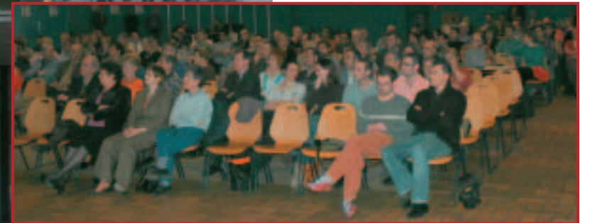
Assemblée générale à Romagnat le 21 avril dernier.

Nous pourrions maintenir ce cap dans la mesure où nos partenaires institutionnels poursuivront leurs aides pour la mise en œuvre d'actions d'utilité sociale qui justifient un financement public. Les collectivités territoriales et le Conseil général en particulier, nous apportent un