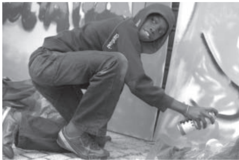
Ce rassemblement a réuni une dizaine d'associations du Puy-de-Dôme, de l'Allier et de la Haute-Loire.

Les juniors associations d'Auvergne ont investi le parvis du centre d'animation de La Gauthière pour la première rencontre régionale qui s'est tenue le samedi 6 juin. Organisé par la Ligue de l'enseignement (FAL et URFAL) et par le centre d'animation de La Gauthière (structure DAJL de la Ville de Clermont-Ferrand), ce rassemblement a réuni une dizaine d'associations venues du Puy-de-Dôme, de l'Allier et de la Haute-Loire. Depuis plus de dix ans, le dispositif "junior association" permet à de jeunes mineurs de s'associer pour réaliser leurs projets de manière autonome. L'organisation d'un forum d'ampleur régionale a permis de valoriser à la fois ce dispositif, les jeunes et ce quartier.