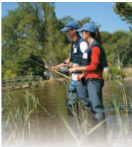
En trois décennies, on est passé de 60 % de votants à 60 % d'abstentionnistes...

Le mode de scrutin et la composition des listes avaient aussi de quoi déconcerter l'électorat : les interrégions préfigurent peut-être le futur découpage administratif de la France qu'il faudra bien se décider un jour à