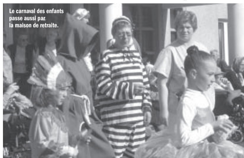
Le carnaval des enfants passe aussi par la maison de retraite.