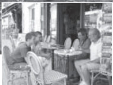
Entretien avec Auvergne laïque.

C'est une association "pas comme les autres" qu'Auvergne laïque a rencontrée à Saint-Éloy-les-Mines ; en quoi est-elle différente de celles visitées jusqu'à présent ? D'abord c'est une "junior association" et ensuite, elle est entièrement tournée vers l'écologie. Le réseau national des juniors associations est né en 1998 d'une idée simple : permettre à de jeunes mineurs de s'associer pour réaliser un projet de manière autonome, en bénéficiant de services et d'un accompagnement adapté. "Nettoie ta planète" a été créée il y a trois ans à l'initiative de cinq jeunes alors âgés de 12 à 14 ans. Ils souhaitaient réhabiliter un lavoir du quartier de Sucharet, abandonné, noyé dans les ronces et les buissons. Ce qu'ils ont réussi à faire après bien des efforts au point de transformer ce site et ses abords en lieu de rencontres et de convivialité. "On est tellement bien ici, à l'abri de la végétation, seulement