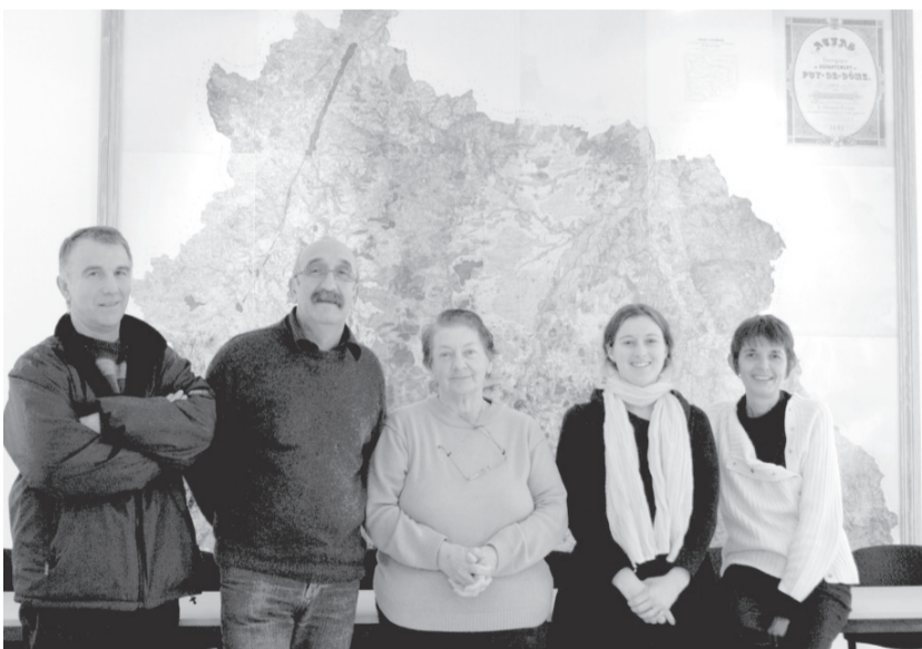
Les dirigeants devant la carte géologique originale de Henri Lecoq (il en existe 2 autres, exposées à la Faculté des Sciences et au Musée de Clermont-Ferrand)