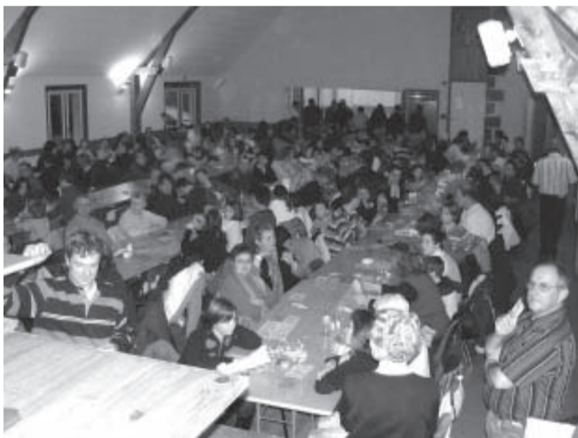
Le loto de l'école.

l'établissement scolaire flambant neuf, une exposition photos. La tâche des dirigeants d'une telle association est lourde et le poste de président n'attire pas forcément beaucoup de candidats. Les forces laïques de Bromont ont su surmonter cette difficulté : plus de président mais deux coprésidents, un homme, une femme, deux sensibilités différentes qui, en bonne harmonie, se partagent les responsabilités ; d'autres amicales peuvent s'inspirer de cet exemple. Les deux coprésidents ont fait chorus d'ailleurs pour saluer les services que leur rend la Fédération des Associations Laïques et en particulier son service culturel.