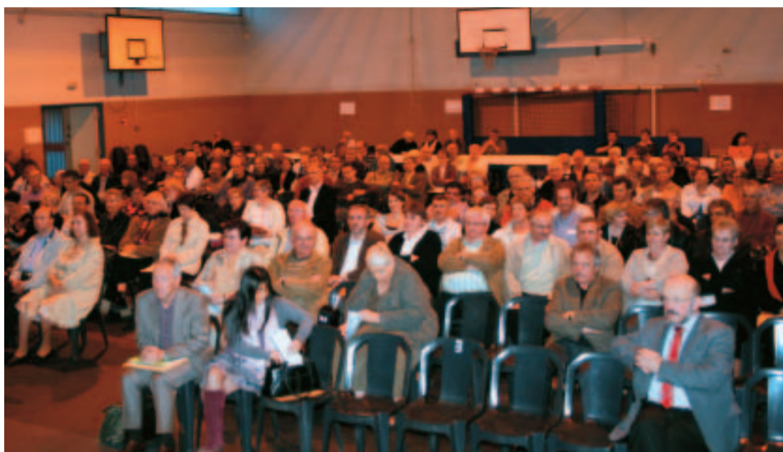
Une assistance nombreuse et attentive lors de l'assemblée générale de la FAL le 30 avril dernier.

Dans le domaine de la laïcité, la Ligue de l'Enseignement ne cesse d'exercer sa vigilance républicaine, de l'appel "Sauvegardons la laïcité de la République" – pour s'opposer aux textes de modification de la loi de 1905 – aux mobilisations de la loi Carle, en passant par le refus