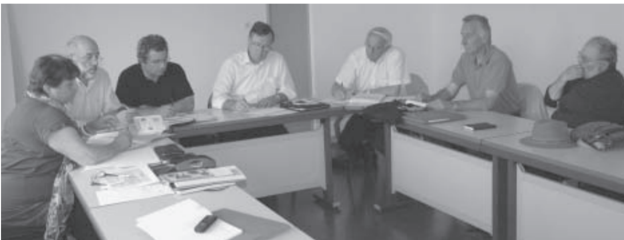
Le bureau de la FAL dans ses nouveaux locaux.