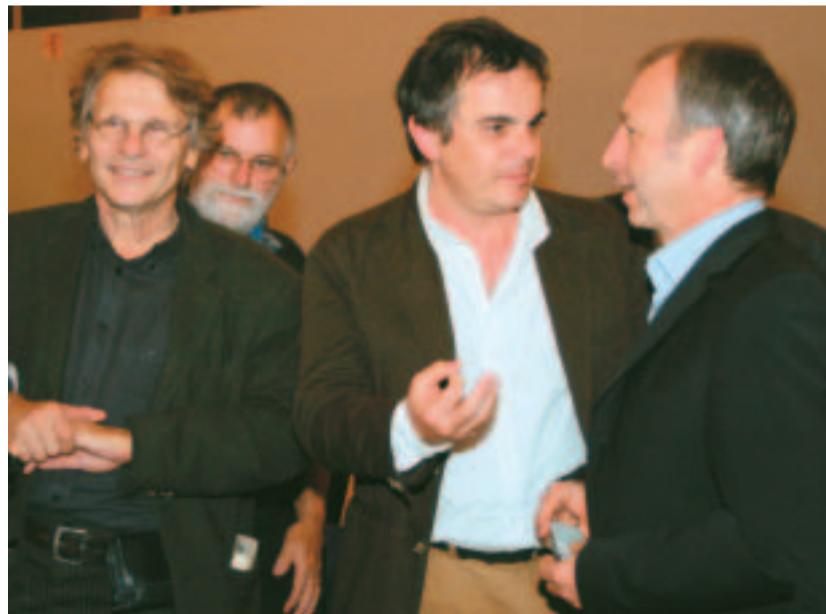
Daniel Pennac et Alexandre Jardin avec deux animateurs de Lire et faire lire.

La lecture y a donc droit de cité et le 10 e anniversaire d'avoir franchi une première étape et l'ambition de voir loin et de voir grand. Forts du soutien des partenaires relayés au niveau départemental par les antennes des Fédérations d'associations laïques (FAL) et des UDAF, de la reconnaissance officielle du ministère de l'Éducation nationale dans le cadre du tout récent plan de lutte contre l'illettrisme, de l'appui de plus de 200 écrivains réunis en comité de soutien, de l'aide d'éditeurs impliqués dans la démarche, ce sont 12 000 bénévoles retraités qui œuvrent auprès de 250 000 enfants dans plus de 5 000 structures d'accueil. Mais le constat des difficultés de lecture demeure et pour les dix ans à venir, le projet est ambitieux : passer de 250 000 à 1 million d'enfants bénéficiaires du dispositif Lire et faire lire. L'implication d'un nombre encore plus important de bénévoles est donc nécessaire d'autant que cette action impose des interventions de proximité dans la bibliothèque proche ou dans l'école du village en accord avec les enseignants. Lire et faire lire est une action généreuse qui montre que la retraite est aussi une contribution à l'intérêt général et la rencontre entre les générations est un excellent moyen de rester "à la page".