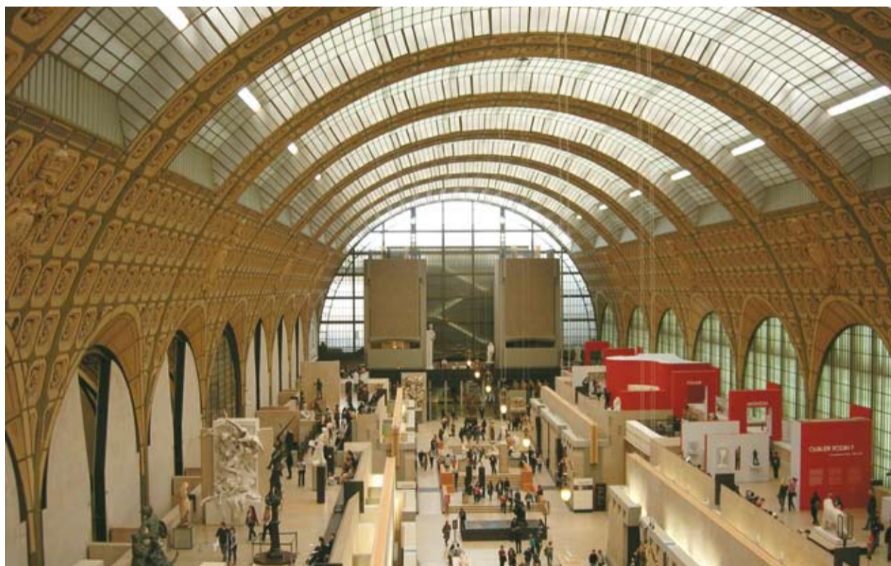
Le musée d'Orsay.

Qu'on en retienne le périmètre le plus large : "Un Homme cultivé est un Homme qui se situe" (1) ou des dimensions particulières (connaissances, arts, sciences, techniques, traditions...), la culture est constitutive du projet d'éducation au suffrage universel de la Ligue de l'enseignement, de sa dimension émancipatrice républicaine et démocratique. Compte tenu de l'état de la société française en 2011 et des éléments relevant de la culture, il est naturel et salubre pour la Ligue de s'interroger sur le travail de la culture dans son projet.