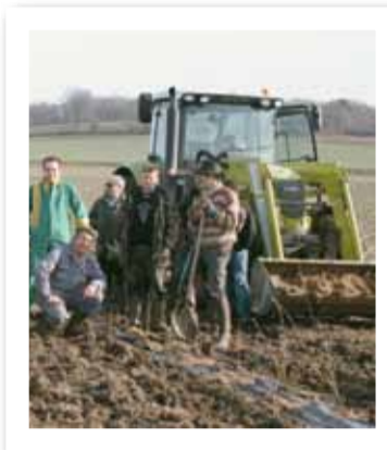
"Les gros ont mangé les petits"

années 80, dans les Combrailles - "très fortes, syndicalement ; on avait barré la 144, et on avait recouvert tous les panneaux indicateurs d'une affiche avec cet avertissement : "Demain vous aurez le désert". Triste prophétie qui n'a cessé de se réaliser : "Nous étions des oiseaux de mauvais augure, et personne ne voulait nous croire. Pourtant nous avions pressenti - avec vingt-cinq ans d'avance - la mort de la paysannerie et la ruine des services publics". Le capitalisme agricole a fait d'une pierre deux coups : non seulement il a favorisé la disparition progressive des petites exploitations - "aujourd'hui, pour survivre et atteindre un indice de travail à l'hectare (I.T.A.) viable, il faut au moins 150 hectares" -, mais il a causé la perte de l'action syndicale ; "le petit exploitant qui ne peut plus embaucher un salarié agricole a trop de travail et ne trouve plus le temps pour militer". Sinistre tableau où s'exercent les fatalités de la condition agricole, exposée aux risques climatiques et aux vicissitudes économiques - "si les banques ne suivent pas c'est l'effondrement" - sacrifiée au cynisme du profit.