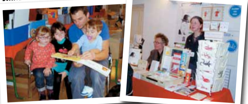
Stand de dévoreurs d'idées !

Les ogres ne sont pas tous enfermés dans les livres. On a encore beaucoup dévoré à Saint-Priest les 16 et 18 novembre à l'occasion du salon du livre jeunesse. A trembler, dans le train fantôme des Editeurs Associés. A croquer, les chimères génétiques de Julie Lannes. A toucher, l'imagerie de Sophie Bureau. A surveiller, Minestrone, la marionnette dévoreuse de livres. Le foisonnement créatif vous donnerait-il le tournis ? Les ogres veillent, éditeurs croqueurs d'éditeurs, qui font passer l'artisan, l'indépendant, le fanfaron, ... dans la marmite à gros biftecons. La louche à racher, à engloûtir, à agglomérer a encore beaucoup fonctionné dans ce petit monde des petits éditeurs... Dessous de plats.