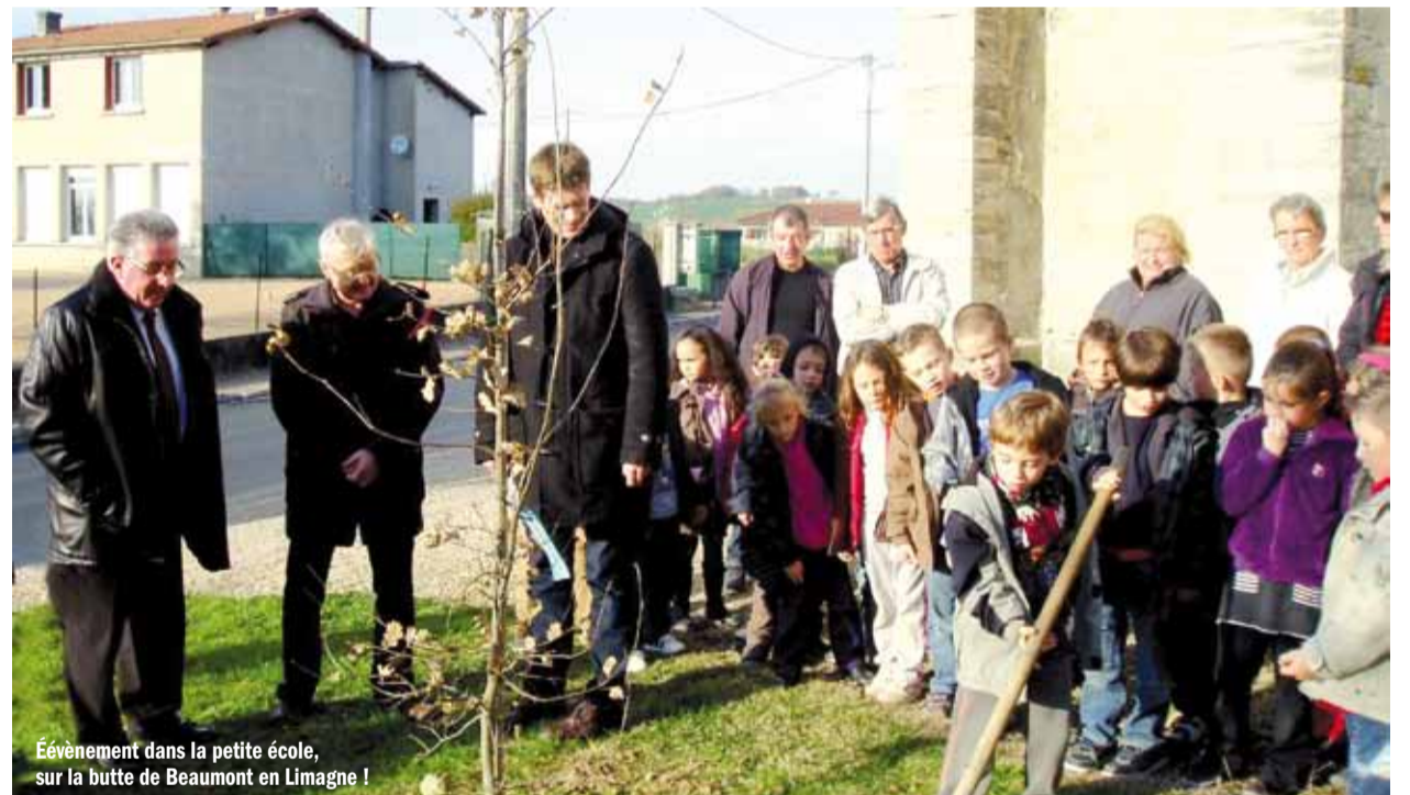
Événement dans la petite école, sur la butte de Beaumont en Limagne !

La Fédération Nationale pour l'École Rurale (anciennement F.N.D.P.E.R., Fédération Nationale de Défense et de Promotion de l'École Rurale), a été créée en 1990 avec pour objectif de défendre les écoles de campagne alors frappées par une large vague de fermetures. Cette structure d'envergure nationale permettait de fédérer de nombreuses actions, de relayer les initiatives locales et de développer un argumentaire plus à même d'être entendu par les décideurs. Ainsi, la fédération participe à un groupe de travail sur l'école rurale mis en place par M. Lebossé, inspecteur général à la demande de Ségolène Royal sur le thème "Pour une nouvelle dynamique du système éducatif en zone rurale isolée".