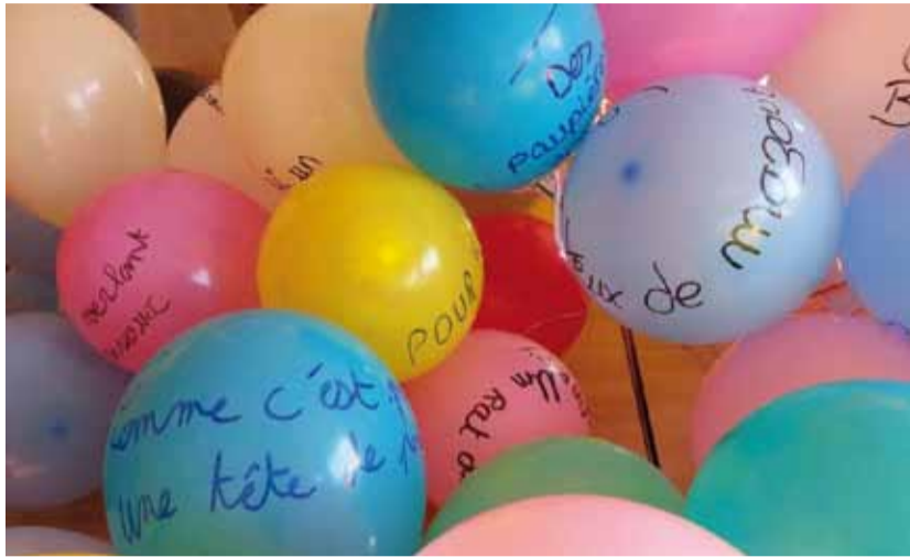
Les ballons offerts au public par les élèves lors de la représentation avec chacun une citation de l'œuvre de Michel Besnier.

Engagé dans un projet d'ouverture culturelle des jeunes en milieu rural, le collège des Ancizes a pour volonté de faciliter l'accès à une véritable offre culturelle de qualité en proposant un travail d'éducation à l'esprit critique à la fois pour l'aspect "culturel" mais éga-