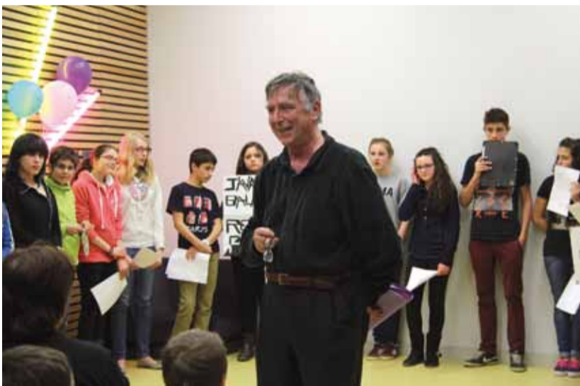
Manifestation poétique dans la cour du collège : "faut-il laisser la poésie aux poètes ?"

tion poétique pour accueillir l'auteur à son arrivée au collège.