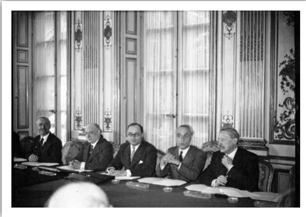
De droite à gauche, MM. Blum, Faure, Zay, Rucart et Brunet, membres du ministère Chautemps - 1937.

Démocratisation et modernisation sont les mots-clés de l'équipe de jeunes membres de son cabinet très à gauche qu'il a choisie.