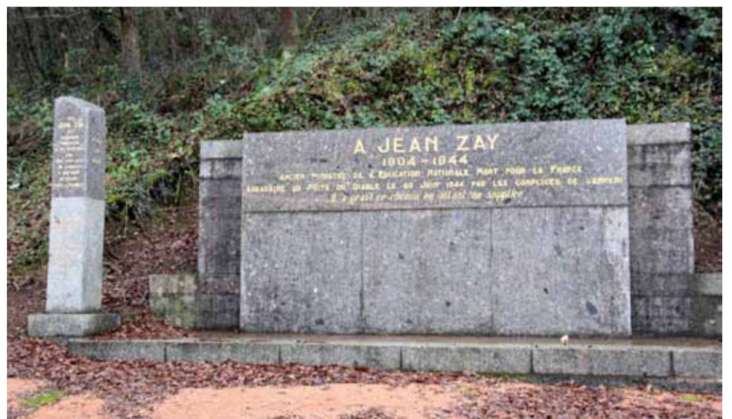
Monument érigé près du lieu de l'assassinat de Jean Zay à Molles (Allier), lieu-dit Les Malavaux.

La nomination de Jean Zay est une surprise, c'est un pari sur la jeunesse et la compétence politique que Blum oppose volontiers à la spécialité technicienne.