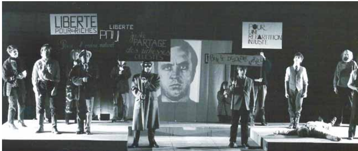
1988 : Mahagony (Berthold Brecht).

S'il a bénéficié de rencontres opportunes et notamment celles d'étudiants de la faculté de Clermont-Ferrand, d'enseignants riomois et de membres de l'Amicale laïque, l'ATR n'a pas été le fruit du hasard. Ce théâtre d'amateurs s'est défini dès ses débuts comme un théâtre populaire et le terrain d'application des méthodes d'animation apprises dans les stages de la Ligue de l'Enseignement (UFOLEA). Chacun a en effet, pensons-nous, quelque chose à dire qui lui est propre, directement ou à travers le texte d'un auteur et c'est dans et par le jeu théâtral qu'il a choisi de le dire. Pour cela l'animateur a la responsabilité de proposer les techniques de jeu qui conviennent : découpage, montage, pratique du contrepoint et de la fugue, démultiplication ou au contraire concentration des rôles, établissement de la