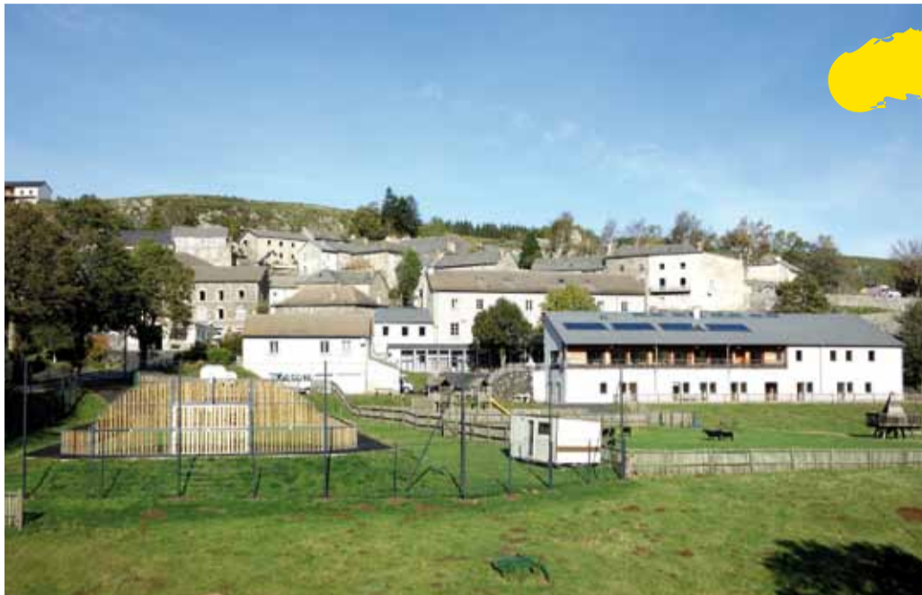
Centre CEMEA de Saint-Front.

Ainsi le tourisme social participe-t-il des progrès qui ont rétabli plus de justice sociale – davantage d'équité – y compris dans un domaine qu'il faut bien se garder de juger frivole : Albert Thomas le soulignait, le droit au loisir c'est tout simplement le droit à sa propre liberté, conformément à l'étymologie. Toutes les associations qui prennent en charge le tourisme social, celui des adultes et celui des enfants, illustrent encore la mission démocratique des structures associatives : elles ouvrent pour tous les portes et les routes du monde.