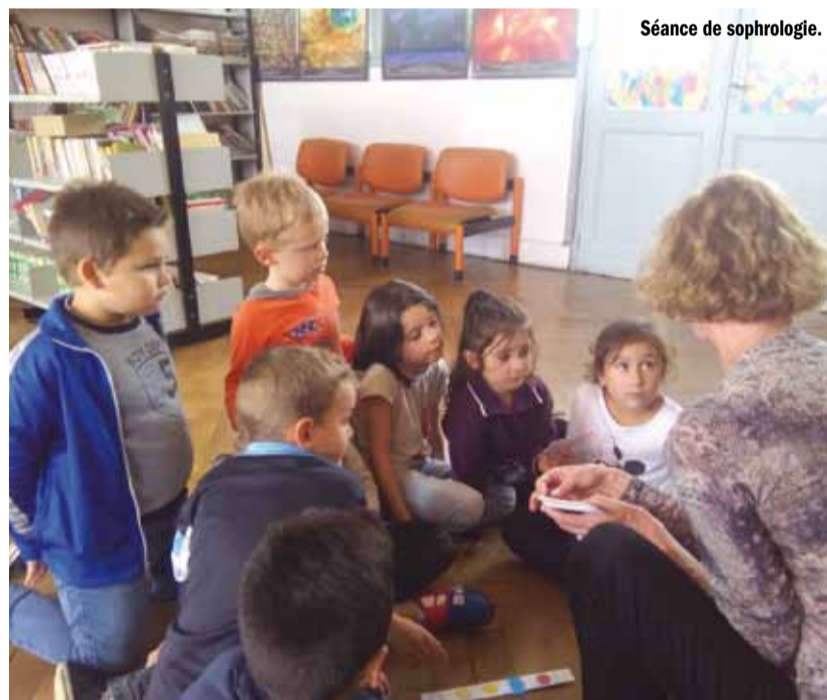
Séance de sophrologie.

Contact : Bruno Gilliet, 04 73 14 79 19 / 06 50 41 85 94 tap@fal63.org.