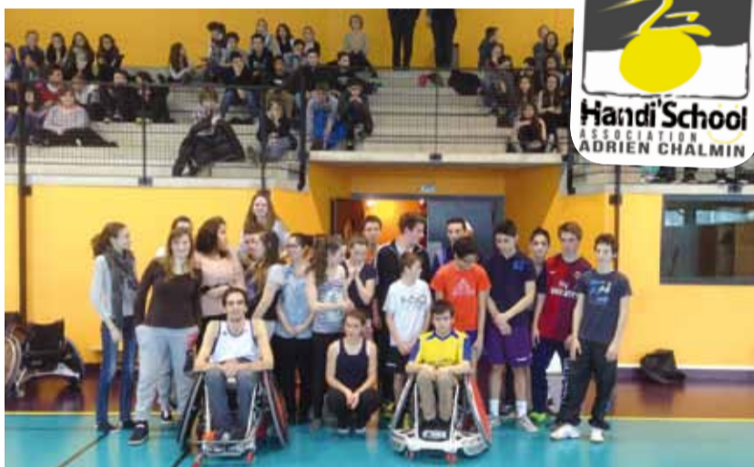
Fin d'un cycle rugby fauteuil EPS au collège de Châtel-Guyon.

L'association Handi'School a articulé autour du rugby fauteuil un projet associatif développé sur trois secteurs d'activité. Le premier objectif est un programme de sensibilisation au handicap dans les établissements scolaires. Le second, est un module de réinsertion sociale et professionnelle en milieu carcéral. Enfin, notre dernier but est de participer et d'améliorer la cohésion d'équipe en entreprise.