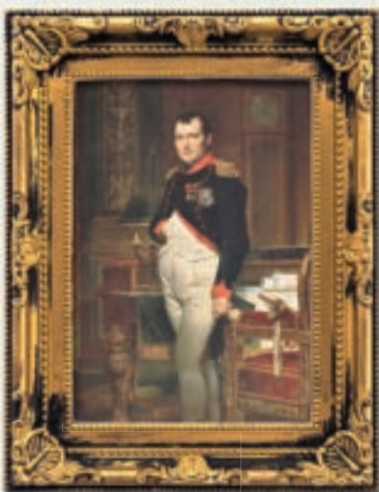
Première République (de 1792 à 1804)

C'est pourquoi, il demeure peut-être dans cette institution présidentielle, chez ceux qui l'exercent et ceux qui la vénèrent le désir d'une figure tutélaire, la nostalgie d'un roi, du sacre... jusqu'à l'échafaud.